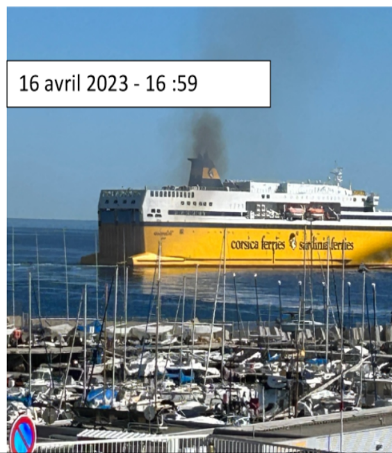
Un Corsica Ferry au port de Nice