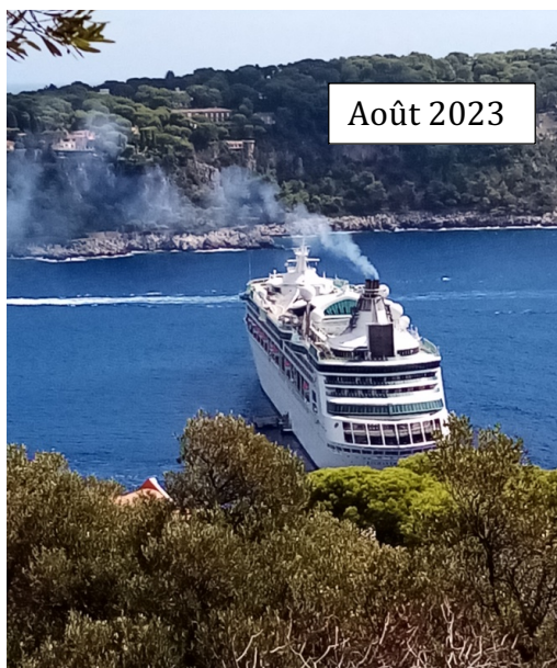
Paquebot en mouillage dynamique dans la baie de Villefranche