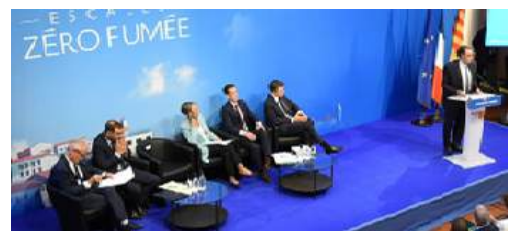
Renaud Muselier présentant le programme « Escalés : Zéro fumée » 06/09/2019

Or la région, l'Etat et les armateurs s'étaient engagés dans un programme « Escalés : zéro fumée » signé en septembre 2019. Nous avons demandé un nouveau rendez-vous après les reports des précédents. Il y sera question avec les responsables de la Métropole et de la Corsica Ferries des prochaines avancées, de la rentabilité des énormes investissements publics et de l'organisation de l'été 2025 sur le port de Nice.